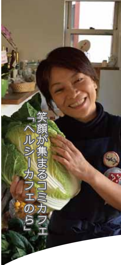
笑顔が集まるコミカフェ 「ヘルシーカフェのら」