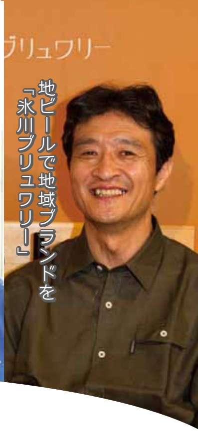
地ビールで地域ブランドを 「氷川ブリュワリー」