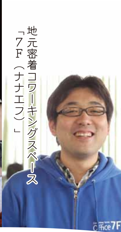
地元密着コワーキングスペース 「7F (ナナエフ)」