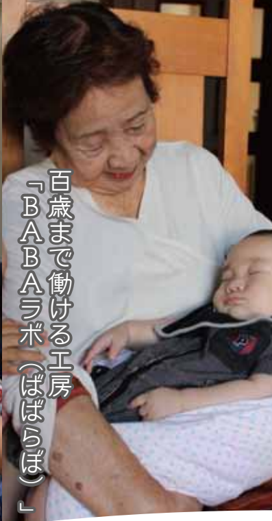
百歳まで働ける工房 「BABAラボ (ばばらぼ)」